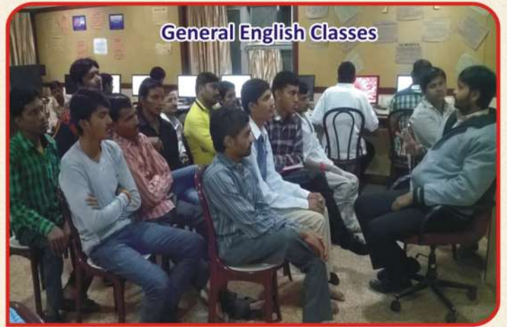
General English Classes