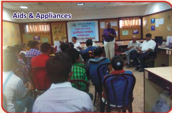
Aids & Appliances