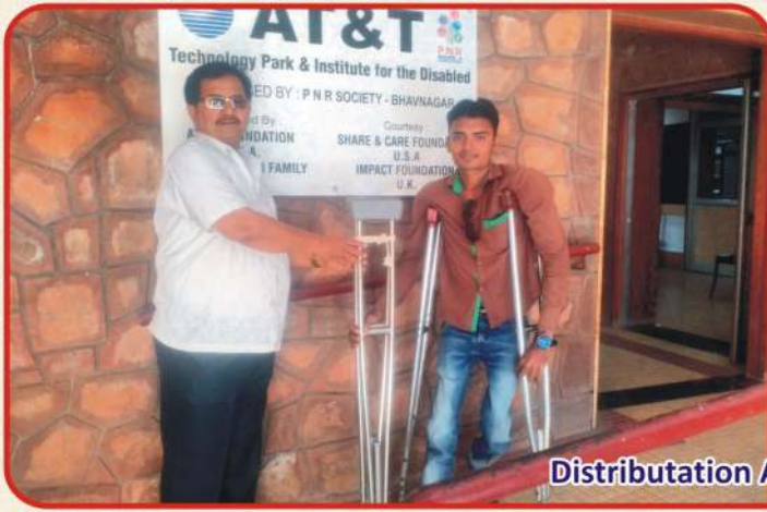
Distribution Aids & Appliances