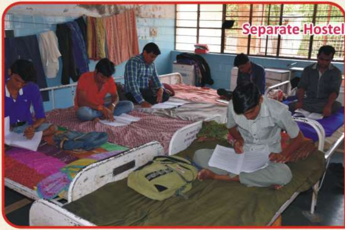
Separate Hostels for Boys and Girls