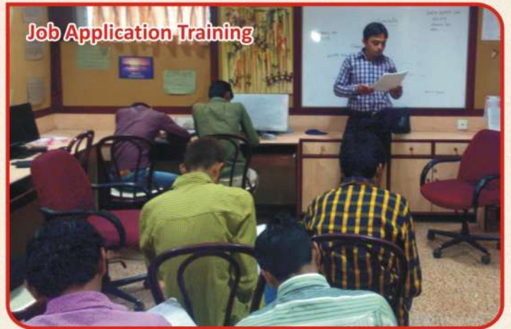
Job Application Training