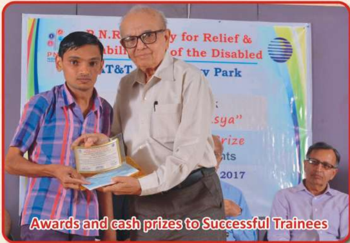
Awards and cash prizes to Successful Trainees