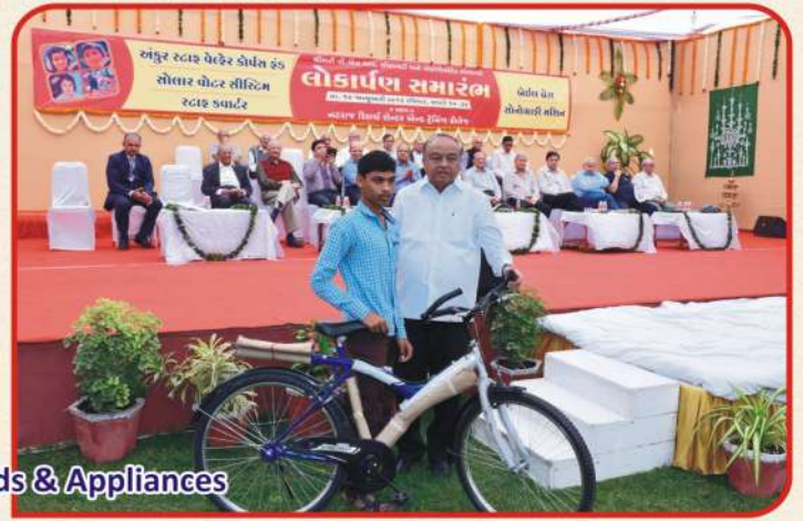
Distribution Aids & Appliances