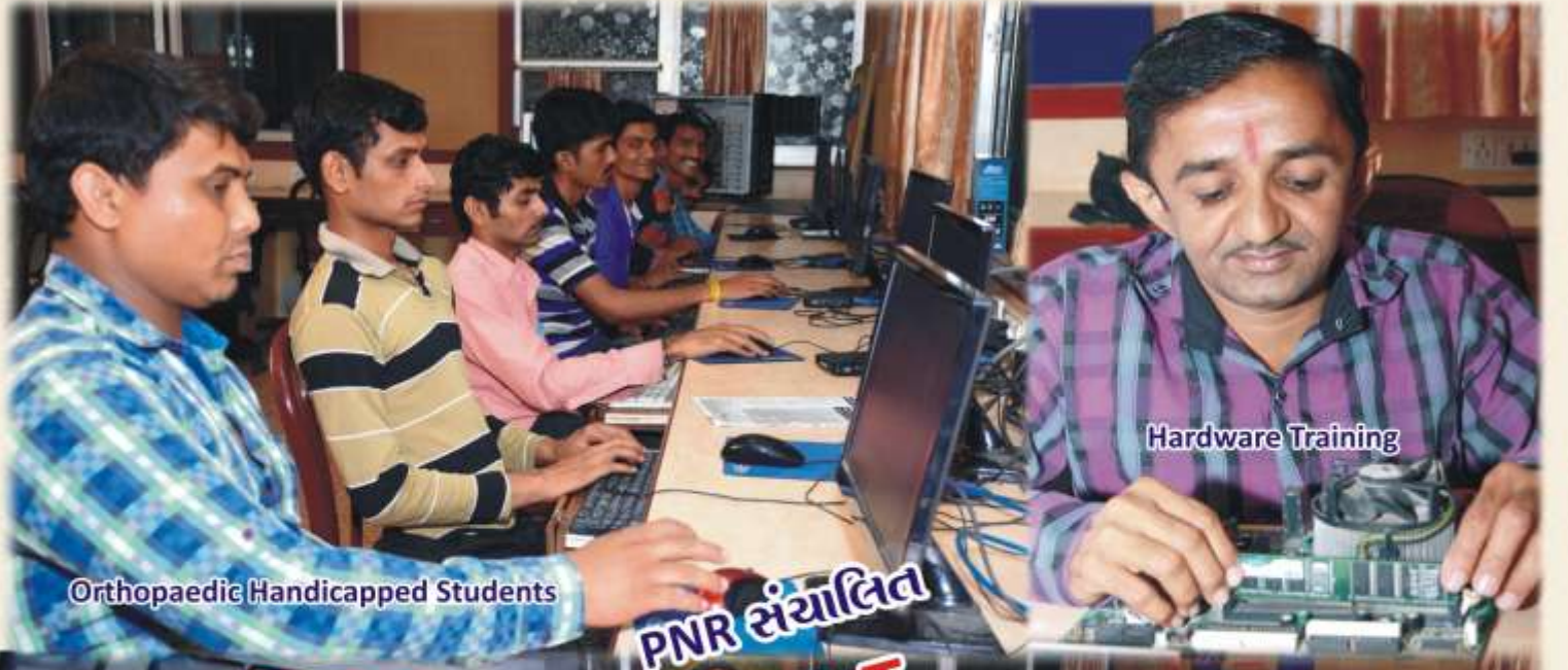
Orthopaedic Handicapped Students