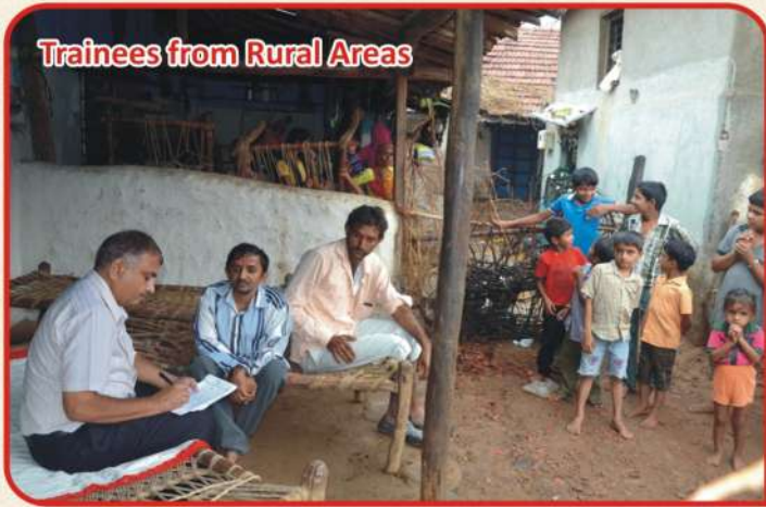
Trainees from Rural Areas

AT&T Technology Park & Institute for the Disabled ORGANIZED BY: P.N.R. SOCIETY - BHUVANESHWAR SPONSORED BY: MAY FOUNDATION SARMI & SONS FOUNDATION U.S.A. SRI CHANDRA FAMILY IMPACT FOUNDATION U.S.A.