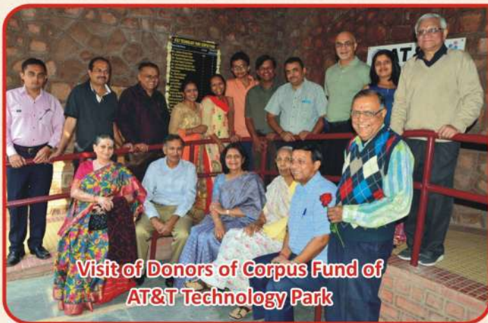
Visit of Donors of Corpus Fund of AT&T Technology Park