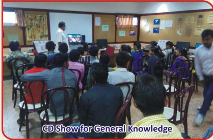
CD Show for General Knowledge