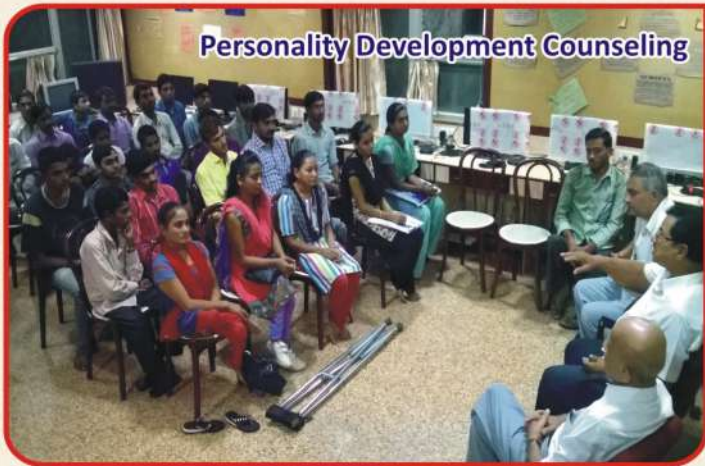
Personality Development Counseling