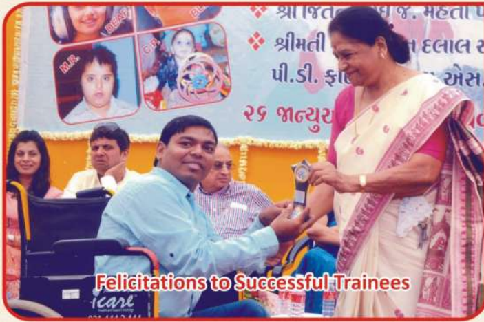
Felicitations to Successful Trainees