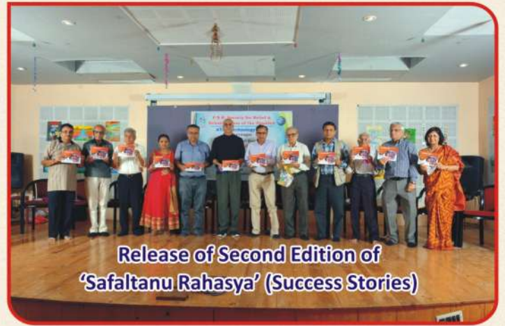
Release of Second Edition of 'Safaltanu Rahasya' (Success Stories)