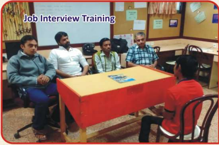
Job Interview Training