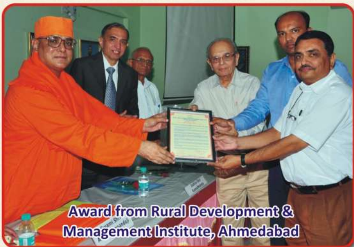
Award from Rural Development & Management Institute, Ahmedabad