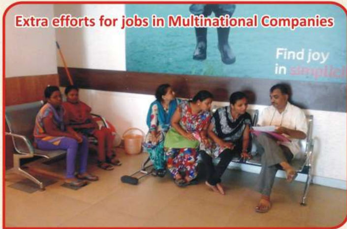
Extra efforts for jobs in Multinational Companies