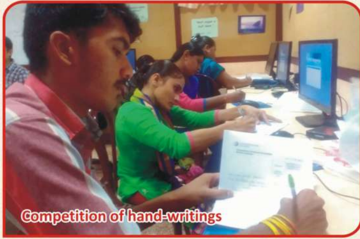
Competition of hand-writings